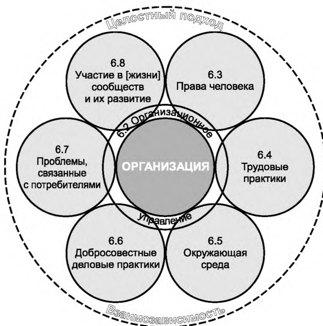
Рисунок 3 — Семь основных тем

Дальнейшие рекомендации для интеграции социальной ответственности приведены в разделе 7.