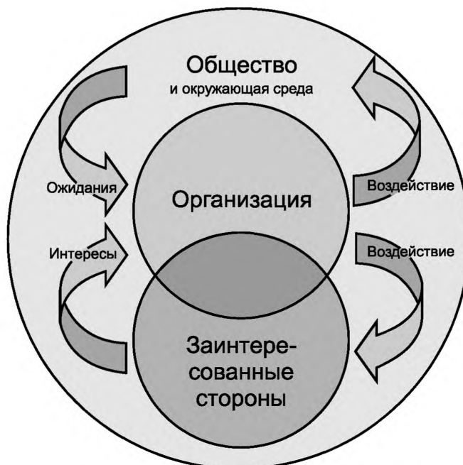
Рисунок 2 — Взаимосвязь между организацией, ее заинтересованными сторонами и обществом

П р и м е ч а н и е — Заинтересованные стороны могут иметь интересы, не согласующиеся с ожиданиями общества.