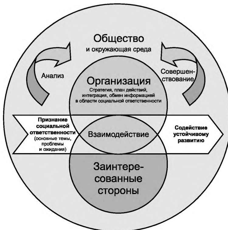
Рисунок 4 — Сквозная интеграция социальной ответственности в организации

Некоторые организации, возможно, уже внедрили техники для введения новых подходов в их [процесс] принятия решений и деятельность, а также эффективные системы информирования и внутреннего анализа. Другие могут иметь менее развитые системы организационного управления или других аспектов социальной ответственности. Нижеследующее руководство предназначено для того, чтобы помочь всем организациям интегрировать социальную ответственность в их образ деятельности.