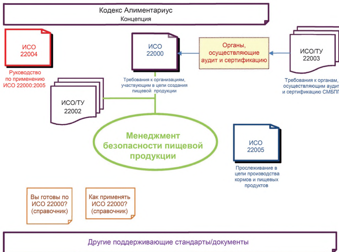
Рисунок 1 — Обзор связанной с ИСО 22000 документации

Справочник [11] по применению ИСО 22000 содержит общие указания для организаций (в частности малых и средних) о том, как разработать, задокументировать, внедрить и поддерживать СМБПП в соответствии с ИСО 22000 [11].