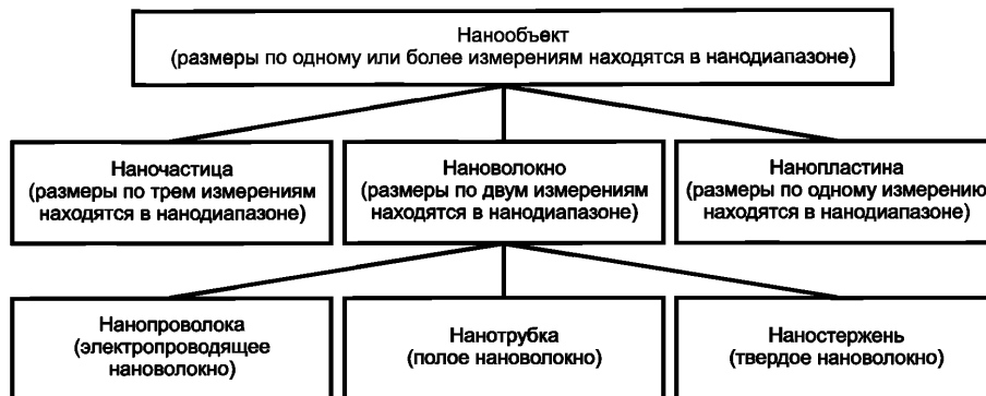
Рисунок 2 — Фрагмент терминологической иерархии нанообъектов