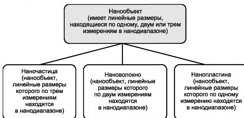
Рисунок 2 — Фрагмент иерархической взаимосвязи понятий, относящихся к нанобъектам

В настоящем стандарте термины и определения установлены с учетом иерархических взаимосвязей между понятиями. Фрагмент иерархической взаимосвязи понятий, относящихся к нанобъектам, представлен на рисунке 2.