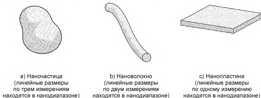
Рисунок 1 — Условные изображения форм трех основных нанобъектов, термины и определения которых установлены в настоящем стандарте

На рисунке 1 представлены условные изображения форм трех основных нанобъектов, термины и определения которых установлены в настоящем стандарте.