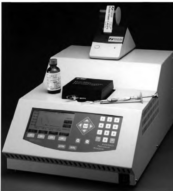
Рисунок А1.3 — Внешний вид аппарата

А1.2 На лицевой стороне аппарата расположены дисплеи и кнопки, как показано на рисунке А1.3 (в зависимости от модели расположение дисплеев и кнопок может отличаться).