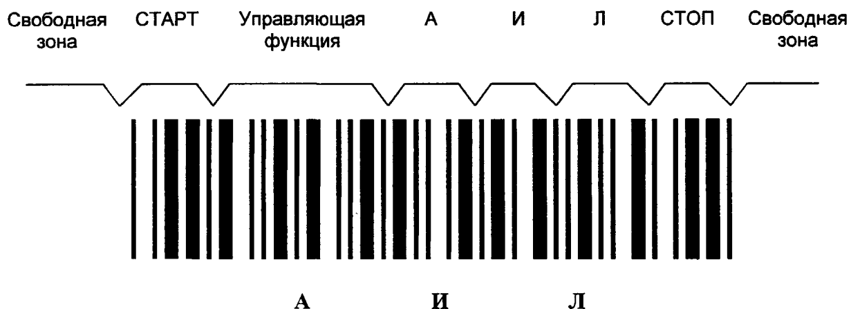
Рисунок Е.1 — Символ штрихового кода, в котором закодированы знаки АИЛ

Е.7 Для обеспечения дополнительной надежности при передаче данных с буквами русского алфавита используют контрольный знак символа набора Код 39РУ.