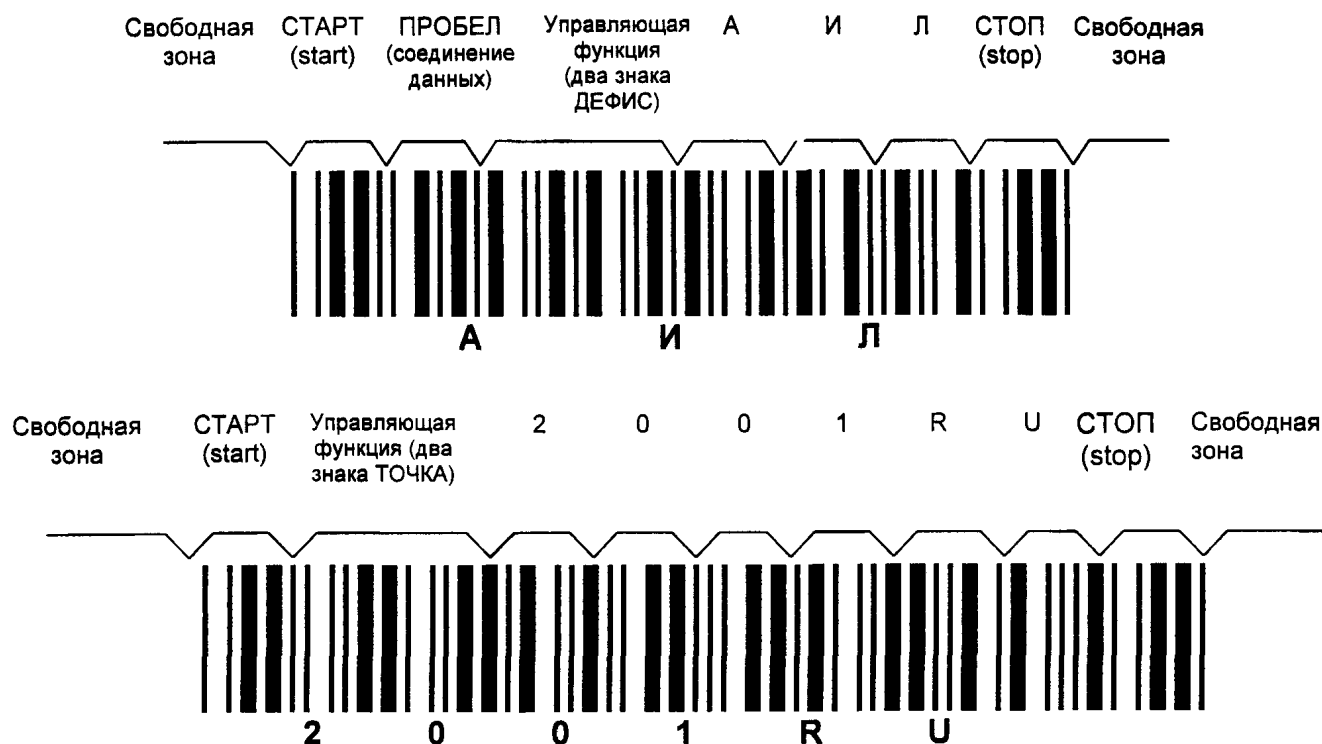
Рисунок Е.2 — Символы штрихового кода, в которых закодированы данные АИЛ2001RU