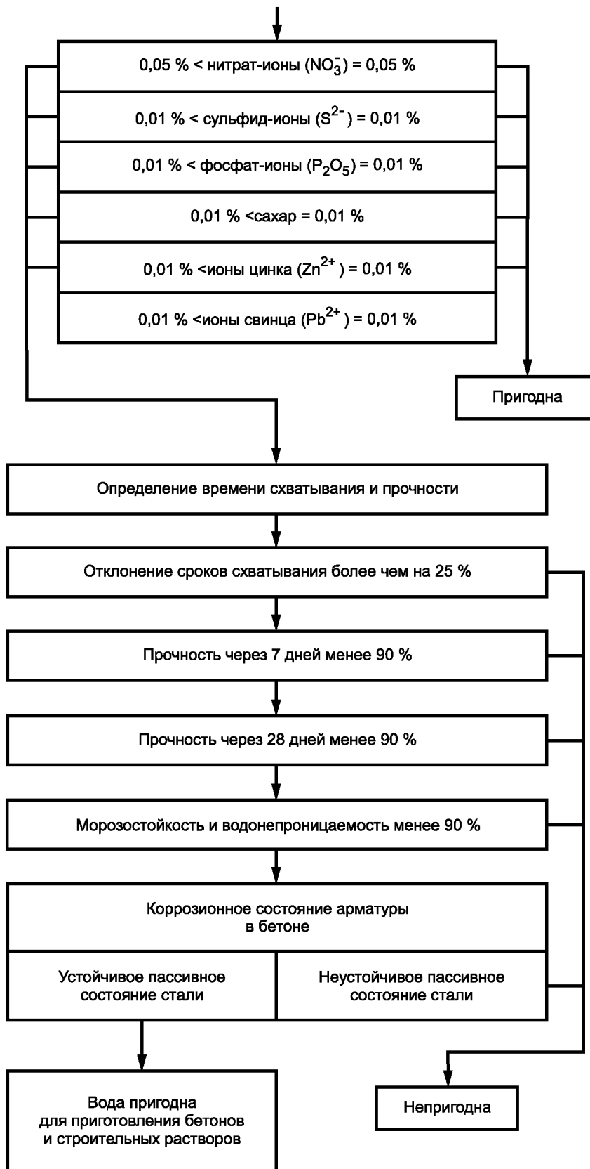
Рисунок А.1 (лист 2)