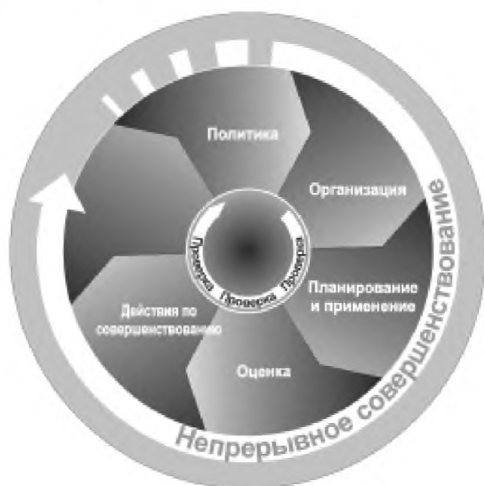
Рисунок 2 — Основные элементы системы управления охраной труда

Обеспечение охраны труда в организации, включая соответствие условий труда требованиям охране труда, установленным национальными законами и иными нормативными правовыми актами, входит в обязанности работодателей. В связи с этим работодатель должен продемонстрировать свое руководство и заинтересованность в деятельности по обеспечению охраной труда в организации и организовать создание системы управления охраной труда. Основные элементы системы управления охраной труда – политика, организация, планирование и применение, оценка и действия по совершенствованию представлены на рисунке 2.