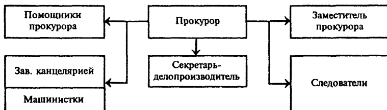
Рис. 1. Организационная структура районной, межрайонной, городской прокуратур

Ориентировочная численная структура органов прокуратуры различных уровней (для руководства при проектировании) приведена в прил. 1 и 2, а схемы их организационной структуры — на рис. 1 и 2.