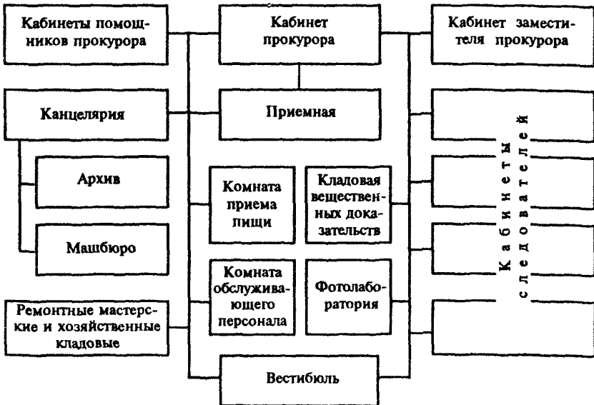
Рис. 3. Схема взаимосвязи помещений в зданиях районной и городской прокуратур